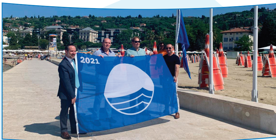
Slika 2: Podelitev Modre zastave na Centralni plaži Portorož 2021

5. V tem letu je zaradi posebnih razmer pandemije COVID-19 ponovno odpadel navtičen sejem, na katerem smo tradicionalno podelili Modre zastave vsem dobitnikom le-teh. Iz tega naslova smo podelitev izvedli individualno.