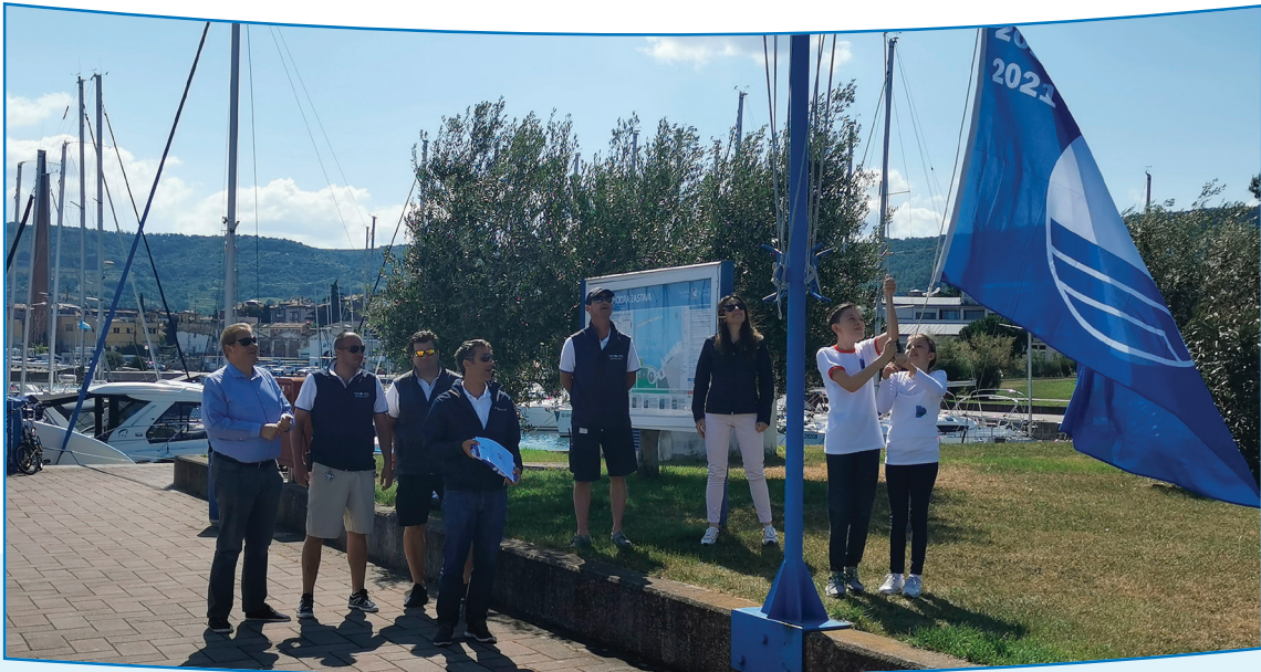
Slika 2: Podelitev prve Modre zastave v letu 2020