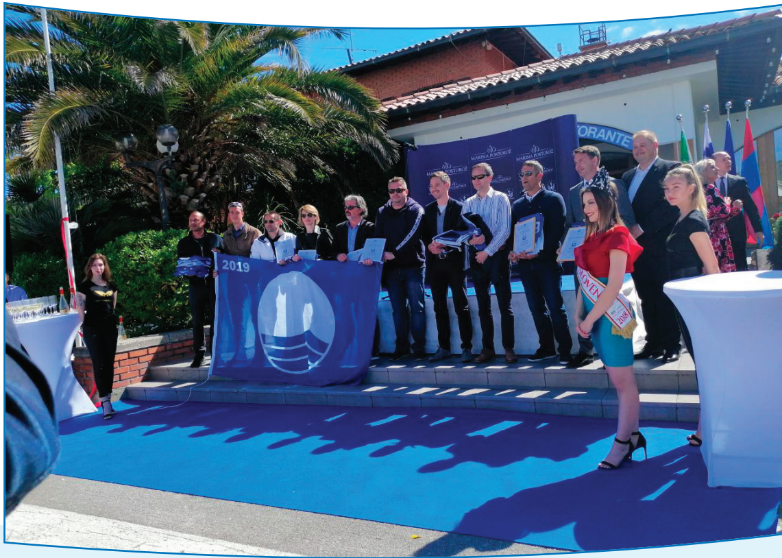
Slika 5: Skupna podelitev Modrih zastav

Nenazadnje smo izvedli tudi tradicionalno svečano podelitev Modrih zastav v okviru otvoritve sejma.