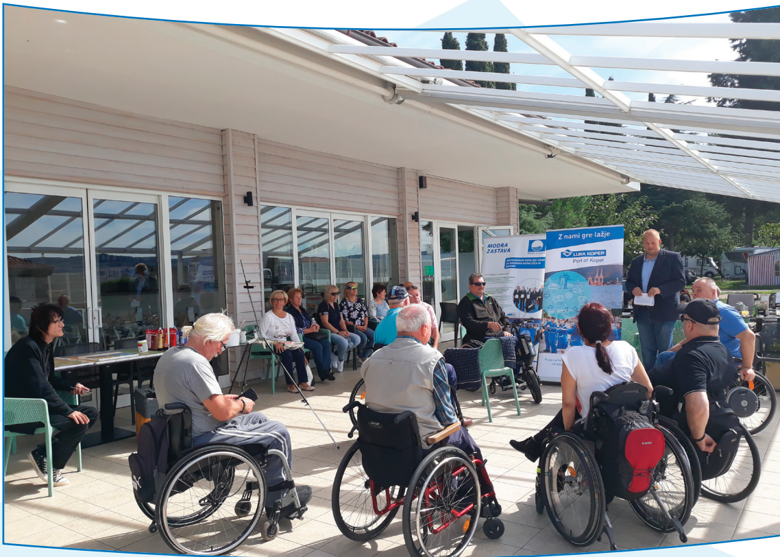
Slika 9: Predstavitev projekta v Ankaranu, fotografija: arhiv Ars Viva

9. Rezultate letošnjega dela in projekta » Modra mobilnost « smo predstavili na srečanju (delavnici) slovenskih paraplegikov v Ankaranu.