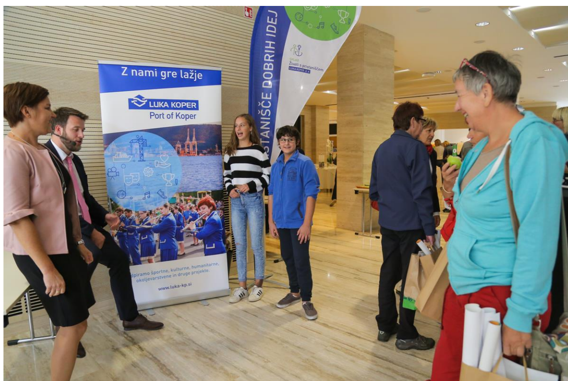
Slika 9: Predstavitve projekta "Mediterska modrina" s strani Mladih poročevalcev za okolje in voditelja prireditve na srečanju slovenskih Ekošol, Thermana Laško