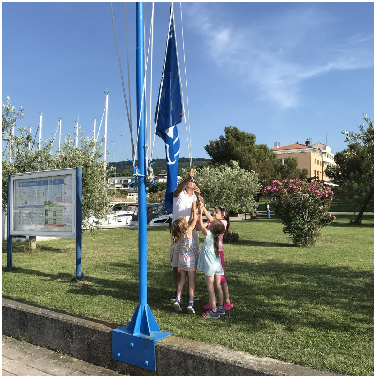
Slika 7: Modro zastavo v izolski marini so dvignile mlade jadralko