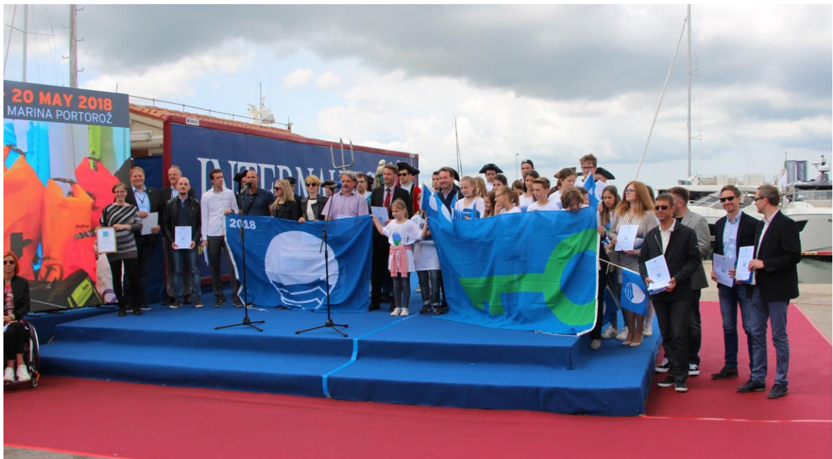
Slika 5: Skupna podelitev Modrih zastav in Zelene zastave v sodelovanju s programom Ekošola