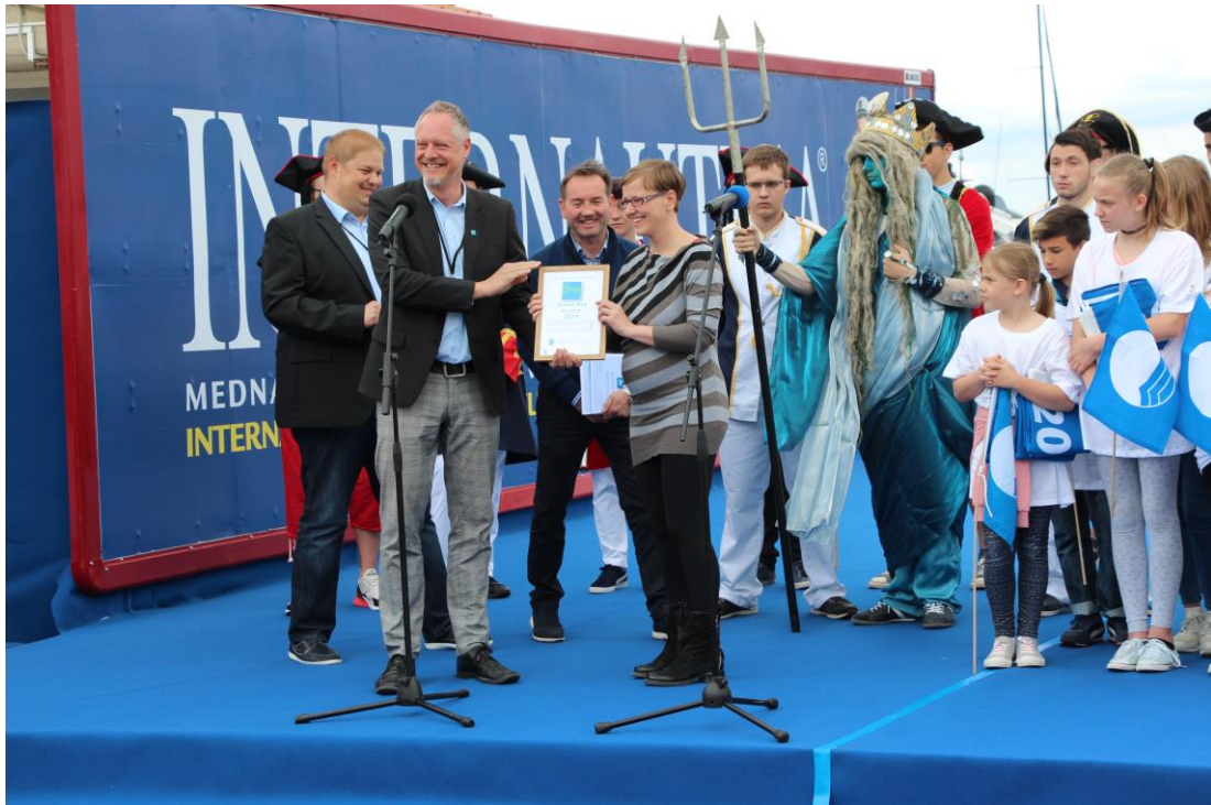
Slika 4: Podelitev prvega slovenskega okoljskega znaka za namestitvene objekte »Zeleni ključ« B&B Pr'Gvedarja s strani Direktorja programa »Green key«, g. Finn Bolding Thomsna