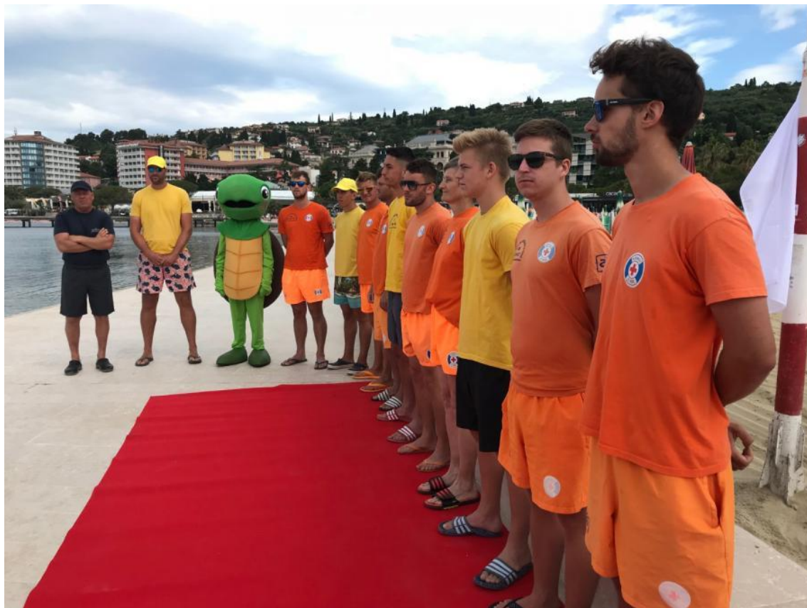
Slika 6: Odprtje Centralne portoroške plaže 2018