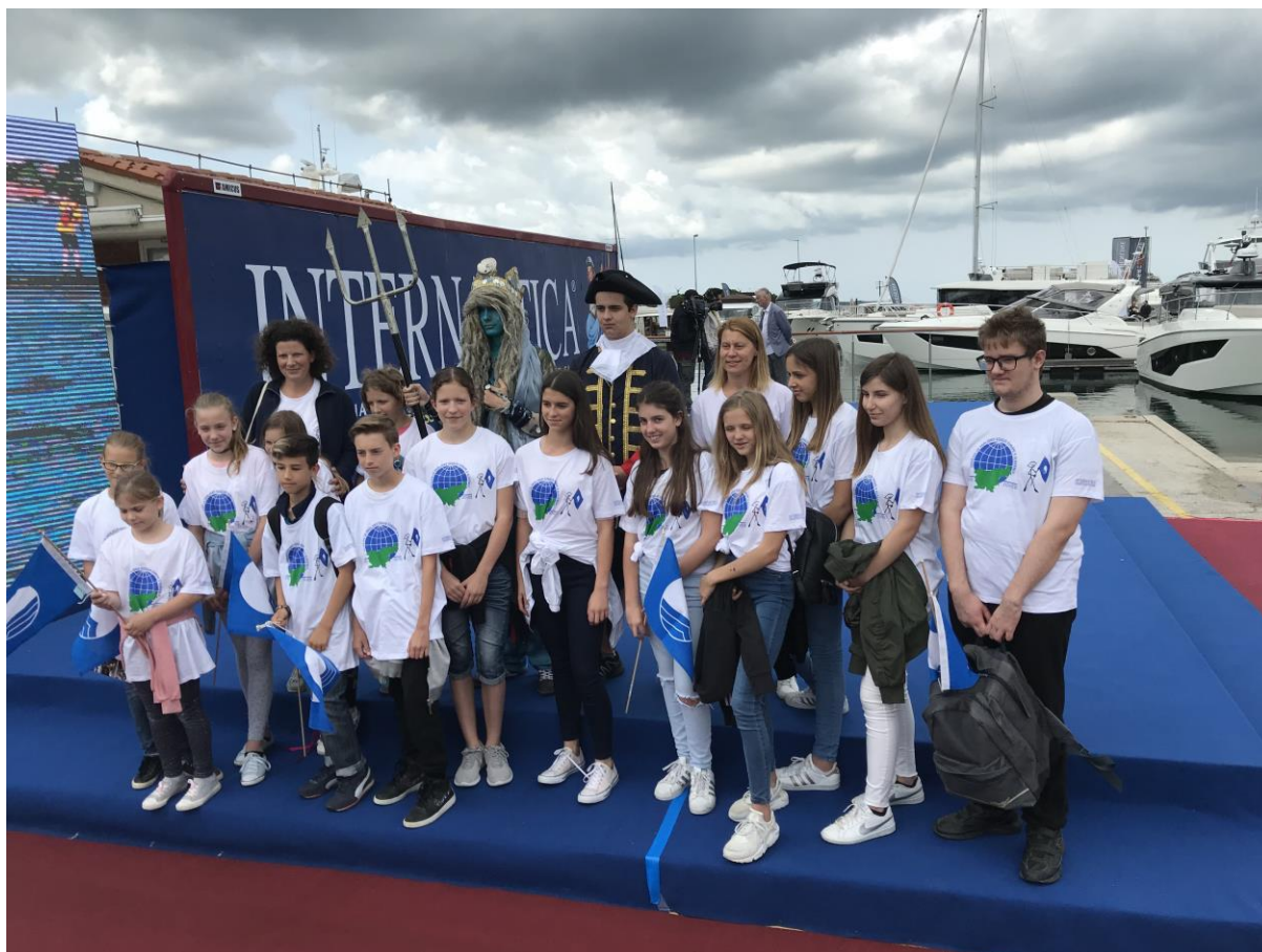
Slika 3: Tradicionalno sodelovanje slovenskih Ekošol na svečani podelitvi Modrih zastav