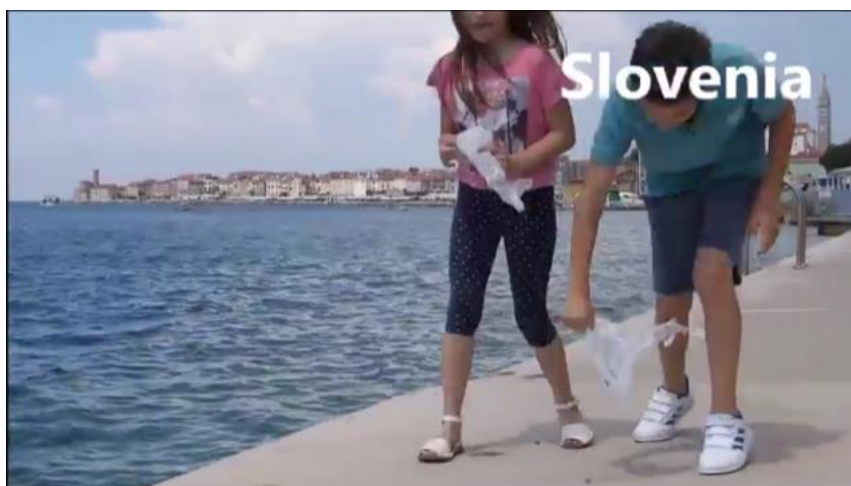
Slika 8: Izsek iz vzgojnega videa pripravljenega s strani mediteranskih držav, članic FEE.