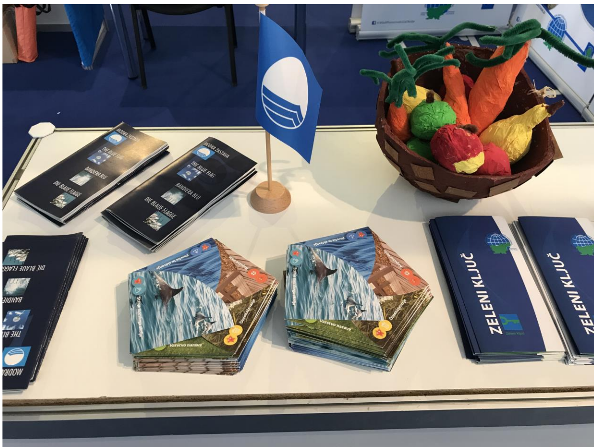
Slika 2: Predstavitev aktivnosti in programov Društva DOVES-FEE Slovenija

Na letošnjem sejmu Internautica, smo gostili tudi učence Osnovne šole Lucija , katerim smo predstavili vse programe okoljske vzgoje, ki jih izvajamo ter se pogovorili o aktivnostih, ki jih sami izvajajo v smeri trajnostnega razvoja.